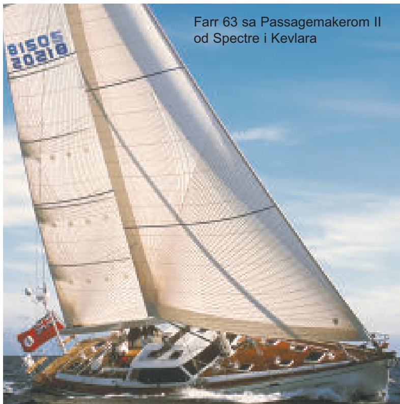
Farr 63 sa Passagemakerom II od Spectre i Kevlara