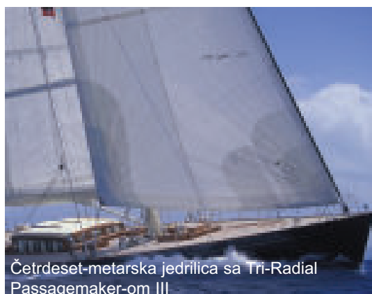
Četrdeset-metarska jedrilica sa Tri-Radial Passagemaker-om III

Za one koji žele jedra manje težine koja zadržavaju svoj oblik bolje od