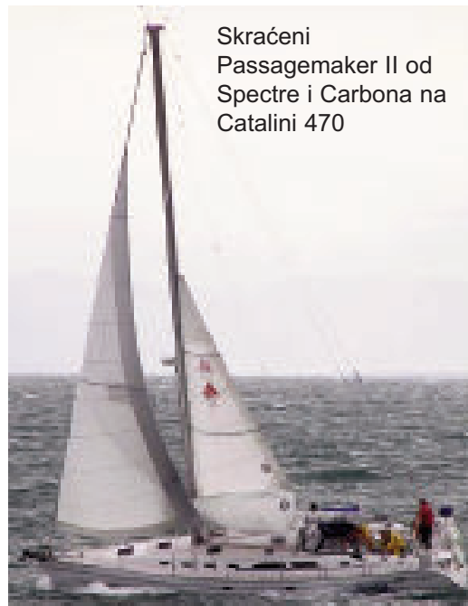
Skraćeni Passagemaker II od Spectre i Carbona na Catalini 470

UK-Halsey uviđa da svako jedro za krstarenje ima dvostruku zadaću. Zato je naša Passagemaker genova dizajnirana za uporabu po jačini vjetra od 0 do 40 čvorova